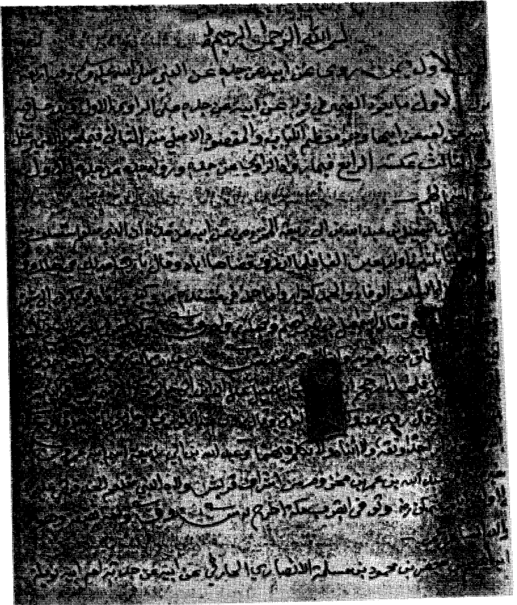
صورة الورقة الأولى في المخطوطة أ